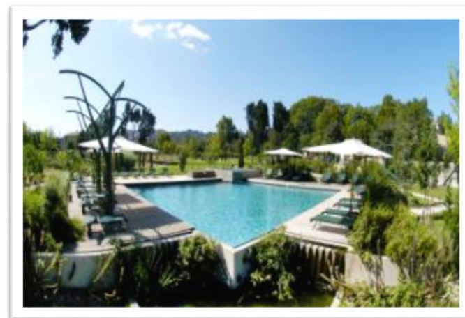
Hôtel de l'Image**** Saint Rémy de Provence