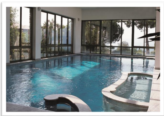
Hôtel Les Bories & Spa***** Gordes Luberon